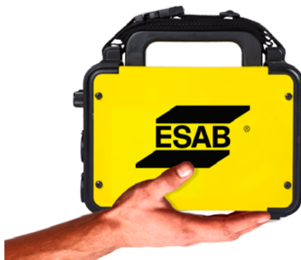
Totalmente portátil - cabe en la palma de su mano y con sólo 3kg.